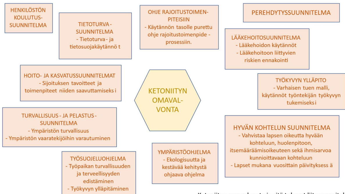
Ketoniityn omavalvonta ja sitä tukevat liitesuunnitelmat

Muita toimintaa ohjaavia suunnitelmia ovat työsuojelun toimintaohjelma, työkyvyn ylläpito -suunnitelma, tietoturvasuunnitelma ja ympäristöohjelma sekä Ketoniityn ohjeistus rajoitustoimenpiteisiin, henkilöstön koulutussuunnitelma sekä perehdytysuunnitelma. Asiakasturvallisuutta varmistaa omalta osaltaan holhustoimilain mukainen henkilökunnan ilmoitusvelvollisuus maistraatille edunvalvonnan tarpeessa olevasta henkilöstä. Kuvassa 2 on kuvattuna Ketoniityn omavalvonnan kokonaisuus liitesuunnitelmineen.